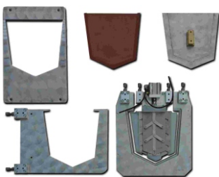
JIG FOR JT864P