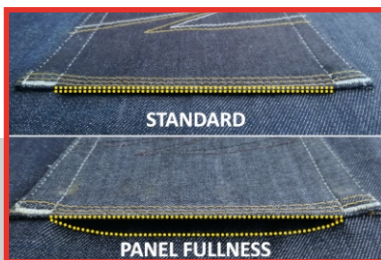
PANEL FULLNESS / AFLOCAR LOS PANTALONES