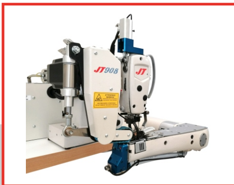
VACUUM CHAIN TRIMMER ELECTRONIC BELT PULLER - PRESSER